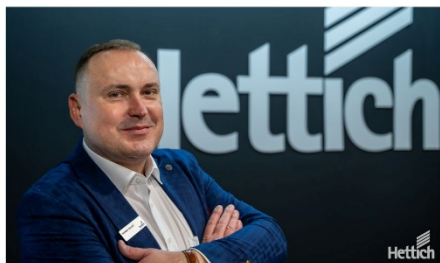
EKSPERCI HETTICH NA STOISKU ŁYGAN DESIGN Stoisko: F2.01