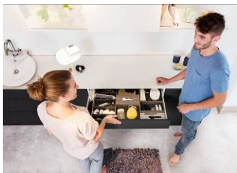
OrgaTray 260 : bringt Übersicht in die vielen Kleinteile im Bad.

Folgendes Bildmaterial steht auf www.hettich.com zum Download bereit: