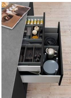
Mit OrgaTray 260 und OrgaStore 260 ist in der Küche alles gut aufgehoben.