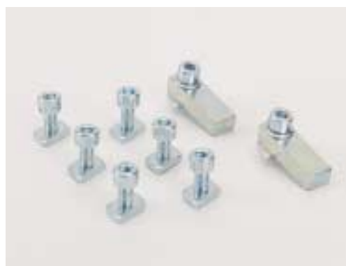
Sada pevných dorazů