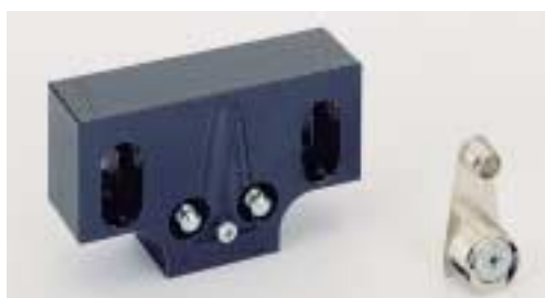
Matrice pro VB 36