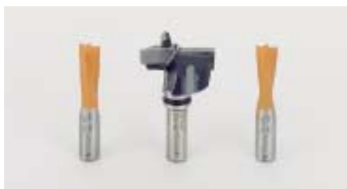
Sada vrtáků pro Blue Max mini