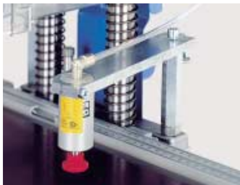
Pneumatické přitlačné patky