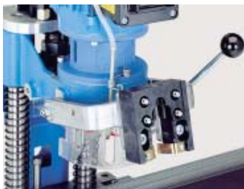
Lisovací třmen pro Blue Max mini Typ 3 vybavený univerzální maticí