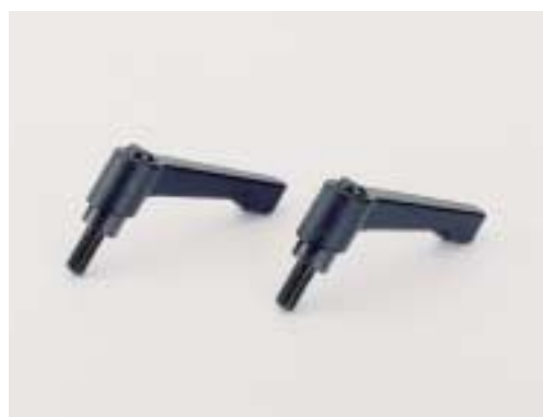
Sada rychloupínacích pák