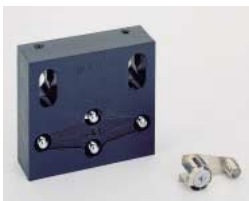
Lisovací matrice pro VB 36