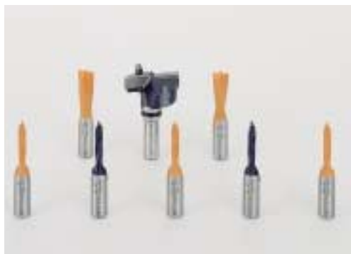
Sada vrtáků pro Blue Max 8