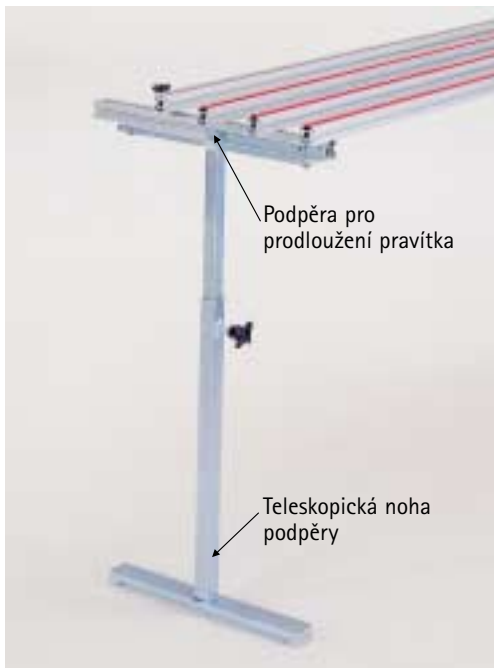
Podpěra pro prodloužení pravítka