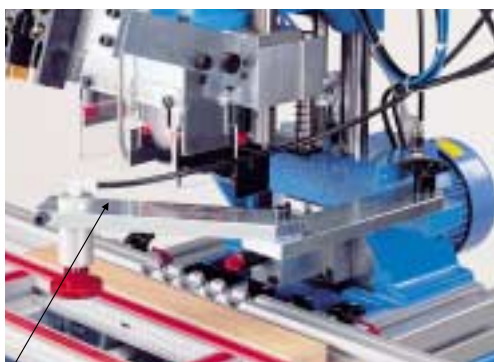
Prodloužení přítlačných patek k použití: