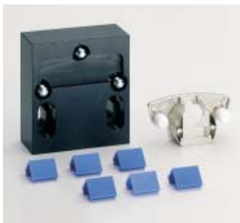
Lisovací matrice/distanční kusy pro Selekta Pro 2000, miska T23