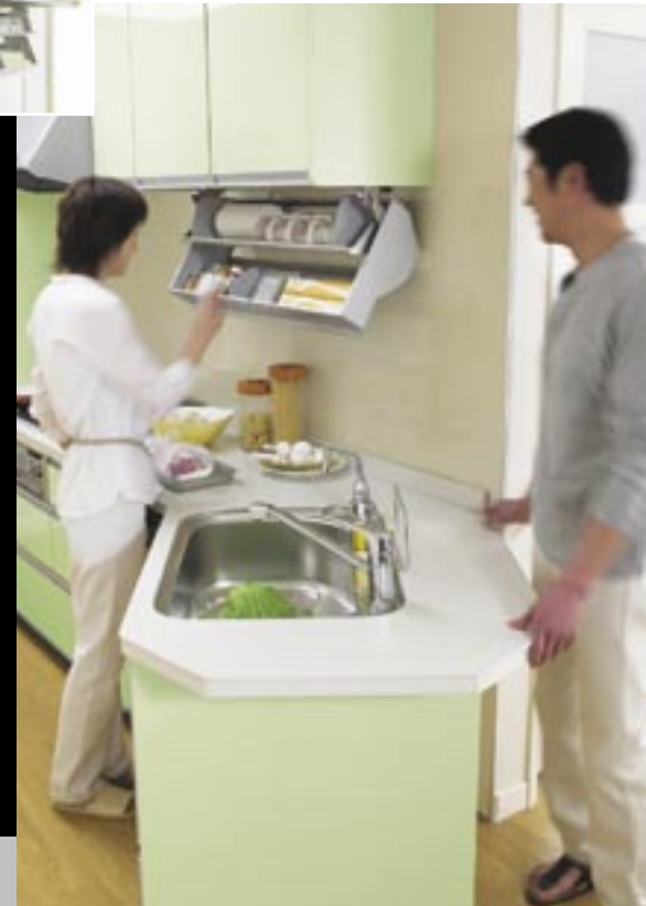
Quickpocket, Sunwave Corporation, Japan [Stauraum in Augenhöhe mit einer Hand hervorgezaubert.]