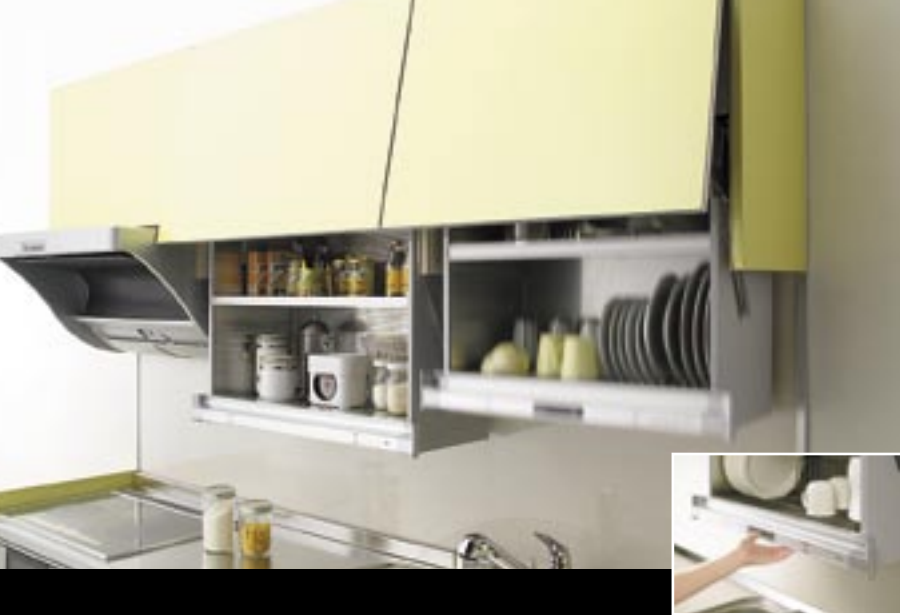
Slide-down wall unit, Sunwave Corporation, Japan [Cupboard and contents slide down for easy access.]