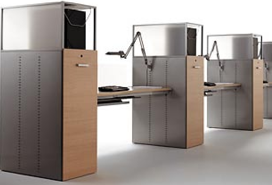
XENON, Ofita, Spain [Workplace system with flexibly organizable storage.]