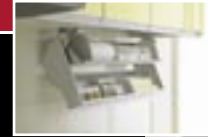
Quickpocket, Sunwave Corporation, Japan [Eye-level storage space conjured up with one hand.]